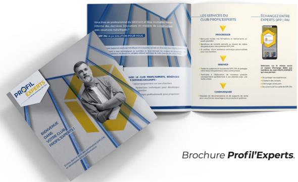
Brochure Profil'Experts .

Pour inscription et tout complément d'information : www.profilexperts.fr