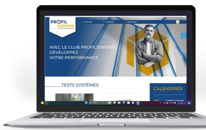
Site internet Profil'Experts .